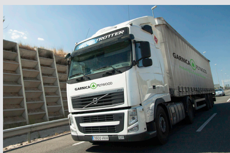
Garnica Plywood exporta el 90% de su producción a más de 30 países en todo el mundo.