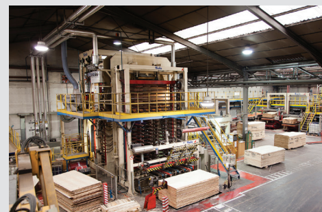
Procesos de producción automatizados con la última tecnología.

Nota: Los datos mostrados en esta ficha técnica son puramente indicativos sin valor contractual. Las características técnicas pueden variarse sin notificación previa en función de nuevos desarrollos y avances tecnológicos. Es responsabilidad del adquiriente determinar si el producto Garnica es el idóneo para la aplicación deseada, y deberá asegurarse de que el lugar y forma de empleo sean los adecuados conforme a las prescripciones y sugerencias del productor, y de acuerdo con la normativa vigente.