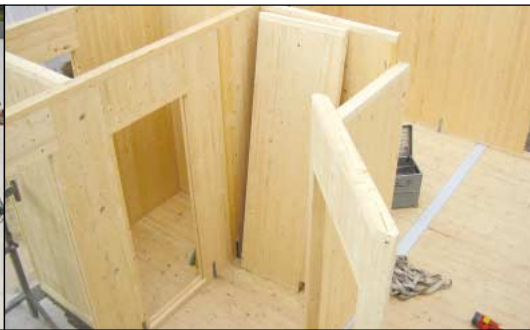
Elementos para paredes