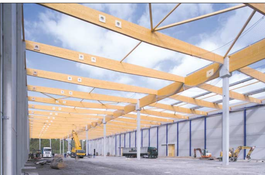
Rhenus centro logístico · Gießen