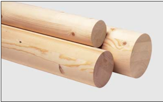
Madeira redonda de "BSH" em Casquinha Nórdica