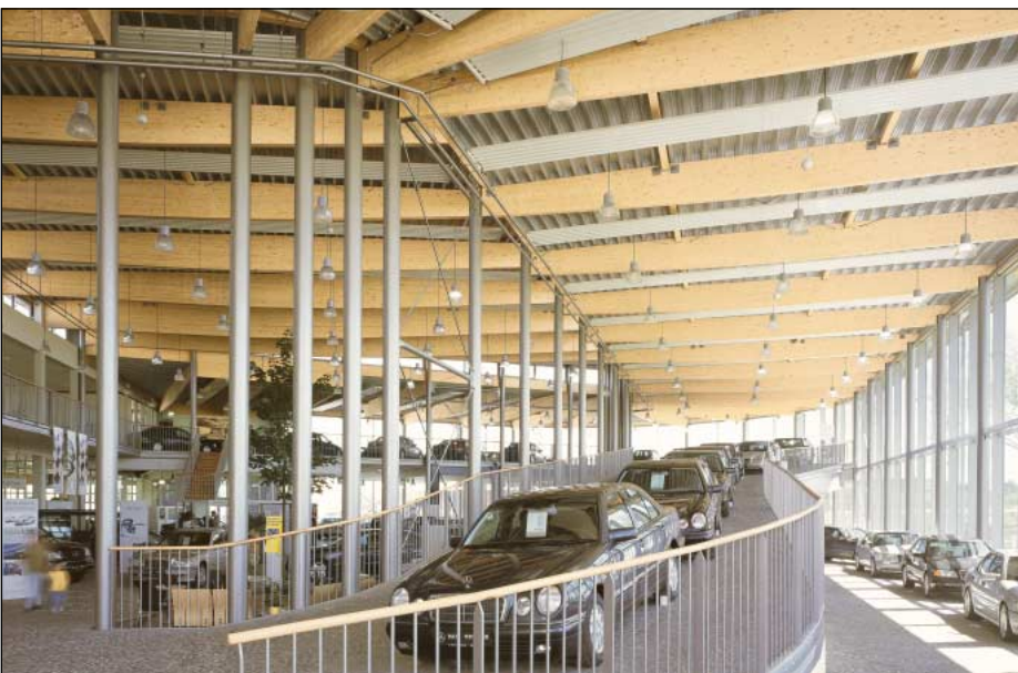
Autohaus Witteler · Brilon

Hüttemann "Ingenieurholz" é sinónimo de construção em madeira de alta qualidade. Construções em Madeira Lamelada/Colada permitem uma ampla variedade de design e flexibilidade. São possíveis comprimentos até 54 m.