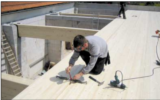
Elementos para tectos