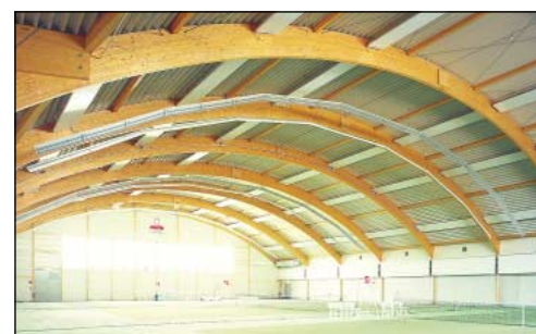
Pavilhão de Tênis · Sportzentrum Herrenkrug

A pedido, oferecemos soluções para construções parciais ou "Chave na mão".