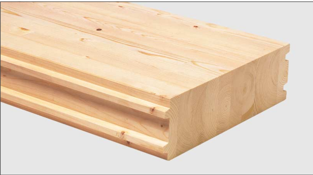
Elementos de Madeira Lamelada/Colada