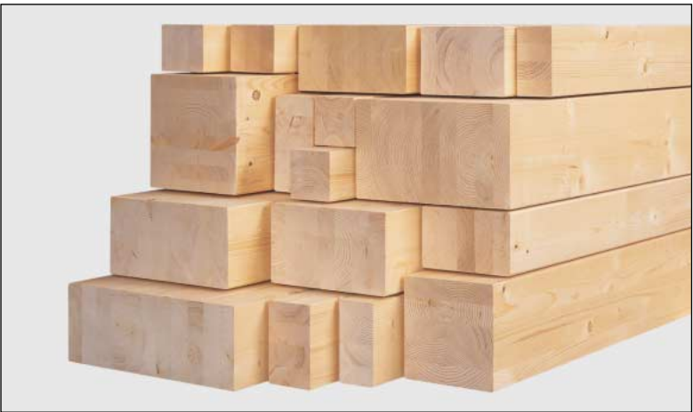
Secções especiais até 24 m de comprimento