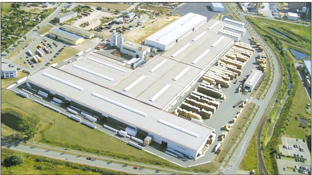
Fábrica em Wismar

Fundada em 1999, a fábrica em Wismar tem uma superfície de 152.000 m² e produz Madeira Lamelada/Colada em paralelo.