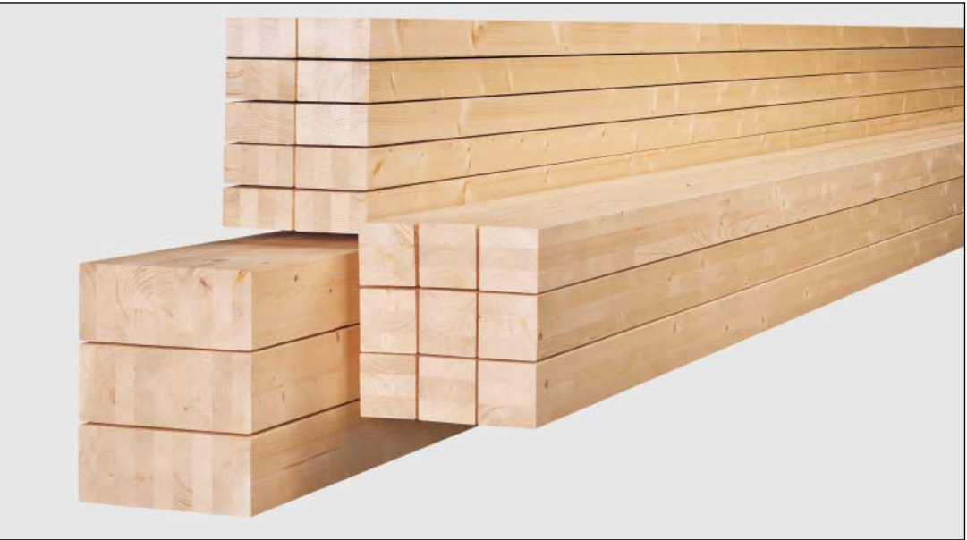
Stock em 10, 12, 14, 16, 18 m de comprimento Secções de 6 / 12 a 20/44 centímetros