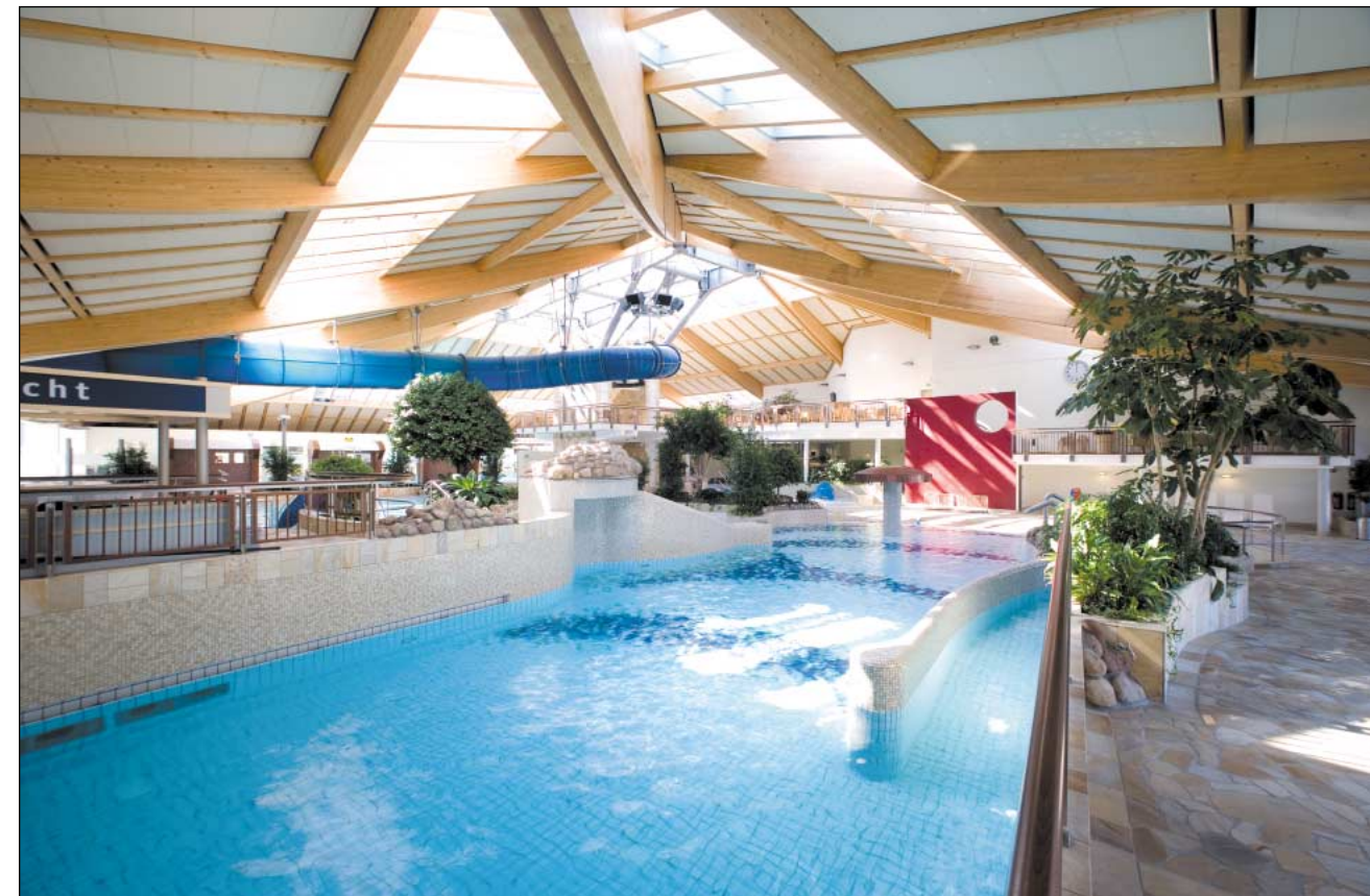
AquaFun · Soest