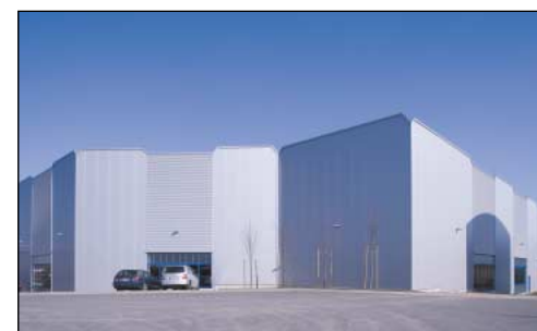
JDEHA · Iserlohn