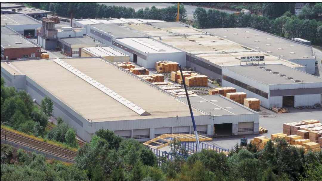
Fábrica em Olsberg

O grupo Hüttemann, fundado em 1891, é uma empresa familiar, na quarta geração e labora com duas instalações na Alemanha.