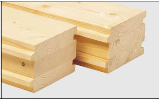
Tábuas para Construção de paredes com macho/fêmea